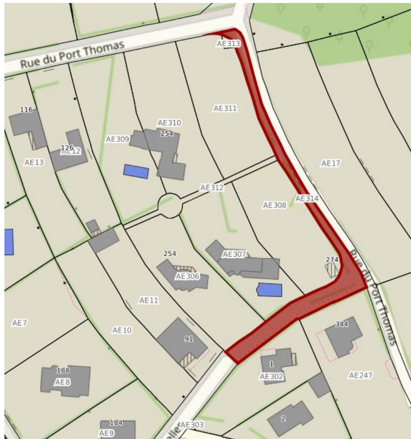
Extrait cadastre – Parcelle AE 314 avant division