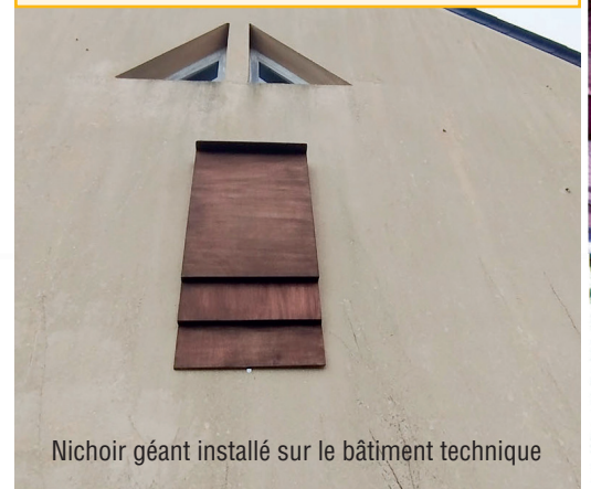
Niochir géant installé sur le bâtiment technique

Peut-être accueillez-vous aussi des espèces inféodées à votre bâti ? Afin de les préserver, si vous envisagez des travaux, une plaquette de sensibilisation est à votre disposition au service urbanisme de la mairie ou dans l'onglet « Biodiversité » sur l'application « IntraMuros ».