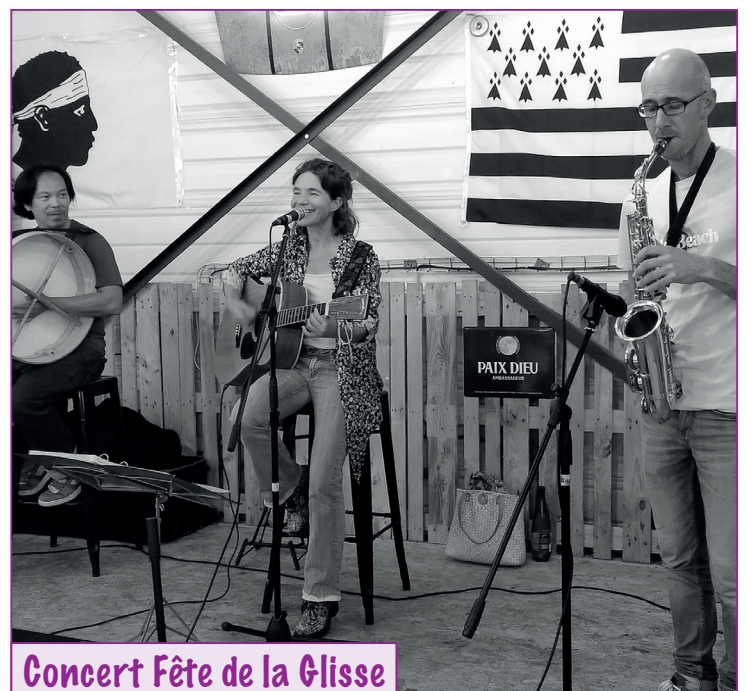
Concert Fête de la Glisse

Organisé par Les Brocanteurs Antiquaires Bretons – Terrain du Marais